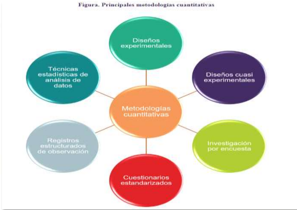
Figura. Principales metodologías cuantitativas